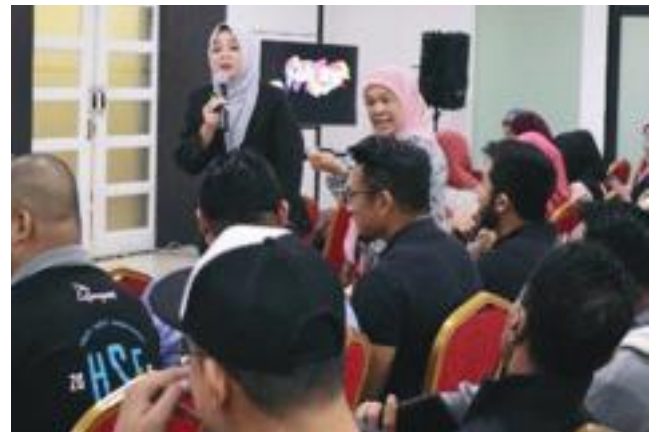
Penceramah berinteraksi dengan para hadirin The speaker interacting with the audience