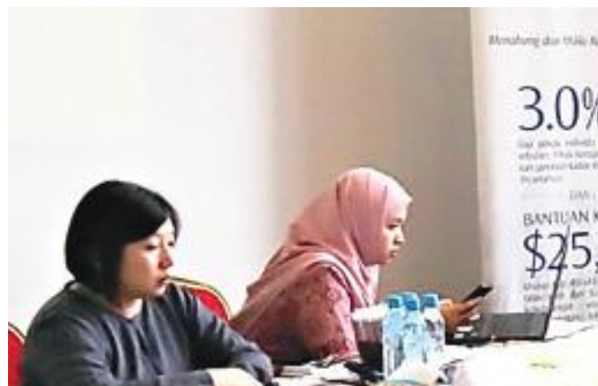
Perancang persaraan dari TAP mengendalikan meja pertanyaan Retirement planners from TAP manning the helpdesk