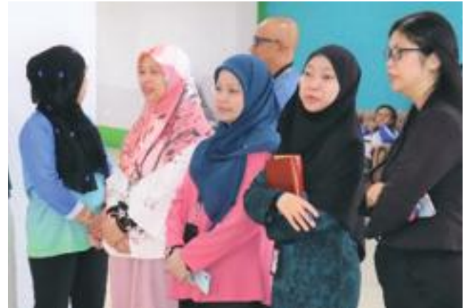
Rakan sekerja dan jurulatih kerjaya dari ketiga-tiga DevCo Associates and career coaches from the three DevCos