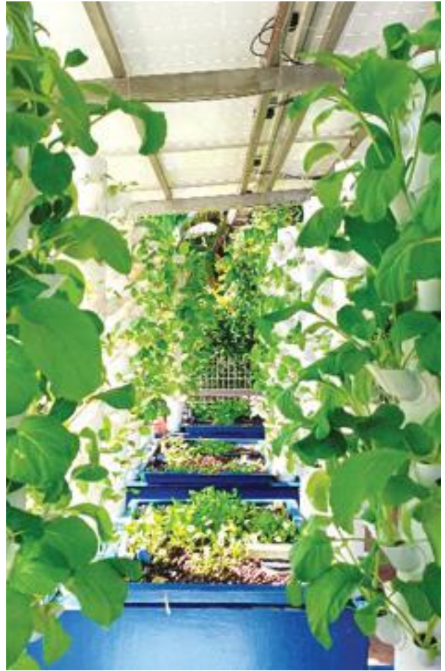
Sayur-sayuran yang tumbuh segar sedia untuk dipetik Fully-grown vegetables ready for harvesting